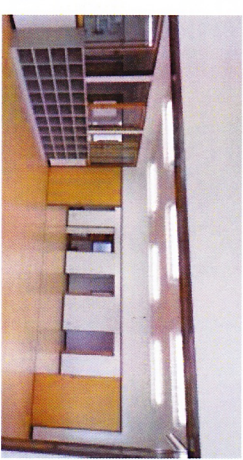
専用施設の整備例