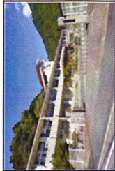
旧山之内小学校を活用したハブ加工施設