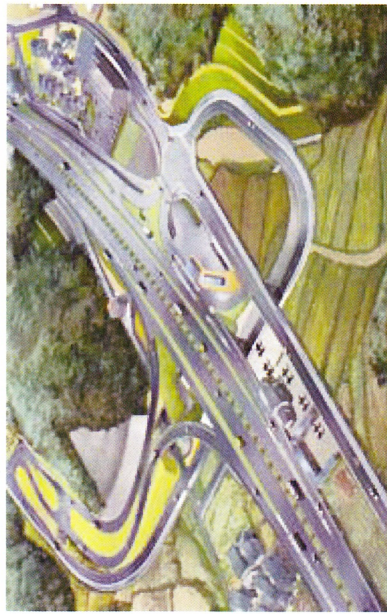
夢前スマートインターチェンジ 整備イメージ